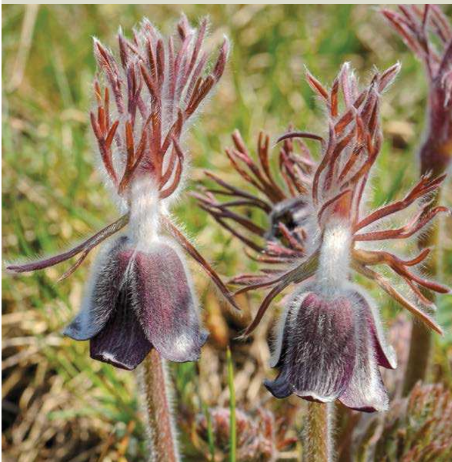
▼ Koniklec luční.