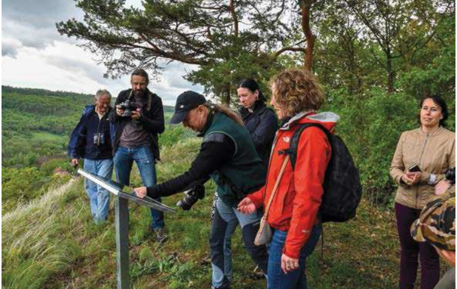
▲ Na vyhlídce (při slavnostním otevření naučné stezky).

Úvodní tabuli stezky nalezneme na autobusové zastávce Bžany, Lbín, na západním úpatí Supího vrchu. Zde se dozvíme základní informace o lokalitě a najdeme také jednoduchou mapku, kudy na vrchol. Jedná se sice s Klubem českých turistů o přesunutí červeně značené trasy do Hradiště, která v současné době vede výhradně po silnici, právě po hřebeni Supího vrchu, zatím k tomu však nedošlo, a tak je nutné spolehnout se na vlastní orientační smysl, případně na modrobílé reflexní šipky, které tu kdysi někdo napíchal