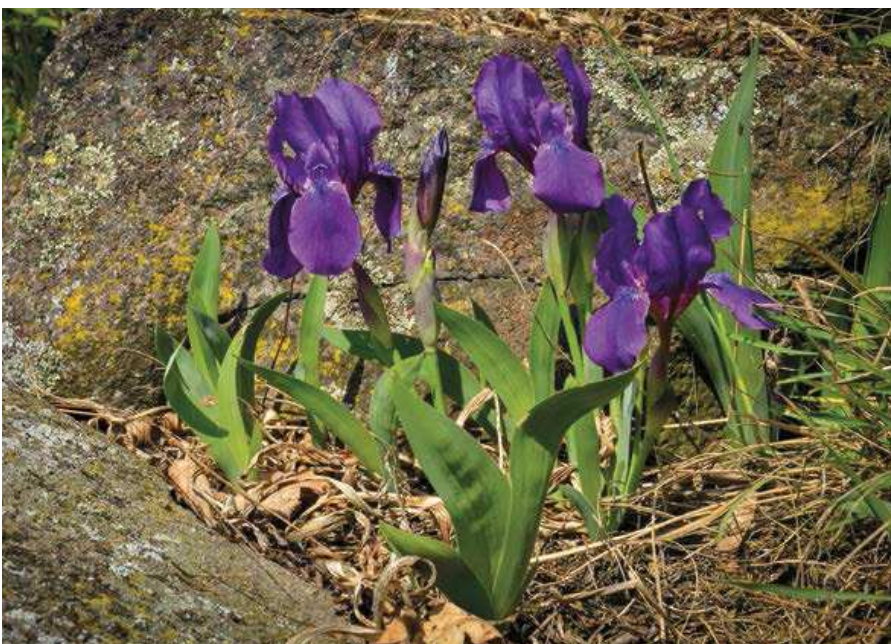
▲ Kosatec bezlistý.