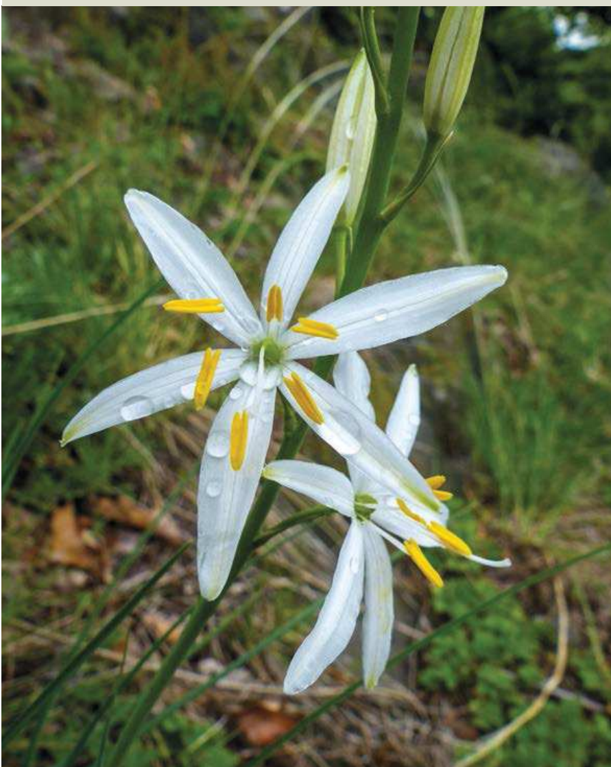
▼ Bělozářka liliovitá.

na stromy. Trasa však není orientačně náročná. Pěšina vede přes louku podél plotu k blízkému lesu, zde zatačí vpravo a pak již stále nahoru, po okraji paseky a po skalnatém hřebínku. Skalky jsou tvořeny olivinickým čedičem, pro čedič charakteristickou sloupcovou odlučnost zde však nenajdeme. Skály mají spíše charakter bochníků či kamenné mozaiky.