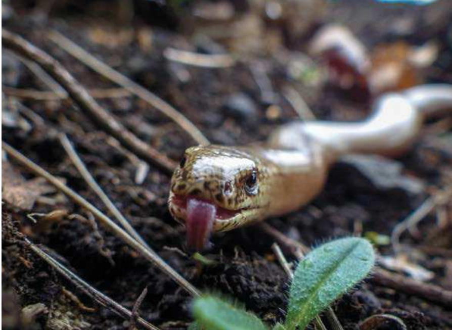
▲ Slepýš křehký.

Supí vrch není žádný velikán, nadmořská výška „vrcholu“ se uvádí 259 m n. m., ale snad právě díky tomu je výhled odtud naprosto unikátní. Unikátní nejen tím, co vidíme, ale hlavně tím, co nevidíme. Nevidíme, že protější kopec (na starších mapách s kuriózním pojmenováním Na lepidlech) je vlastně ohromný kameňolom, neb z této strany jeho plášť není narušen. Nevidíme, že jsme pouhé 4 kilometry od teplických sídlišť. V okruhu do 15 kilometrů se nachází rozsáhlá ústecká aglomerace s chemičkami, povrchové hnědouhelné doly, tepelná elektrárna Ledvice, několik dálnic. Na Supím vrchu nic z toho netušíme. Vidíme jen lučinaté údolí s malebnými vesničkami, kterými se klikatí řeka a lokální železnice, a kolem zalesněné svahy. Supí vrch je zkrátka takový „Hobitín“, skrytý před problémy vnějšího světa, byť ty hrozí nedaleko. ■