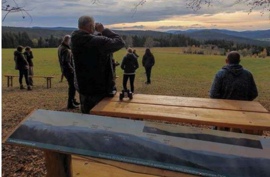
▲ Tak co, jsou vidět Alpy?

Ty alpské vrcholky, které za dobré viditelnosti vykukují nad hlavním