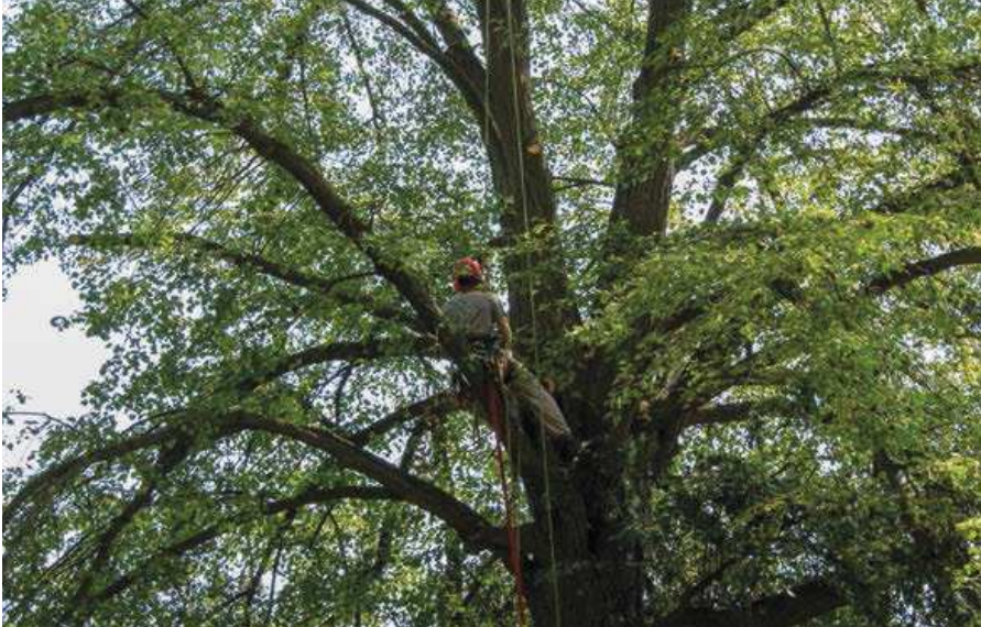
Arboristické ošetření lipové aleje u Bohumilic.

již čistě managementový. Ošetření se dočkalo dalších 42 lip, zároveň byla celá alej vyčištěna od náletových dřevin a dosazeno dvanáct nových stromků, aby měla alej kontinuitu i do budoucnosti. Částečně díky dalšímu projektu Blíž přírodě, tentokrát čistě managementovému, částečně ze státního Programu péče o krajinu.