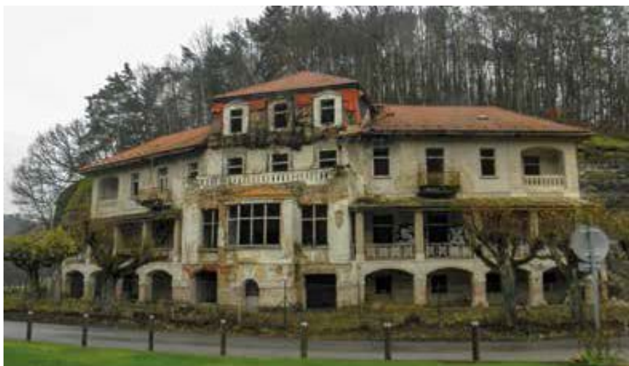
▲ Hotel Harasov dlouhé roky chátral, ale nyní se snad znovu pomalu probouzí k životu ▼ Jedna ze skalních dutin pod harasovským hrádkem

Čeká nás poslední stovka metrů – druhý nejkrásnější úsek trasy. O zajímavých skalách už bylo psáno. Ukrývají však i mnoho stop lidské činnosti. O některých se ví, jak a proč zde vznikly (dva čínské symboly zde