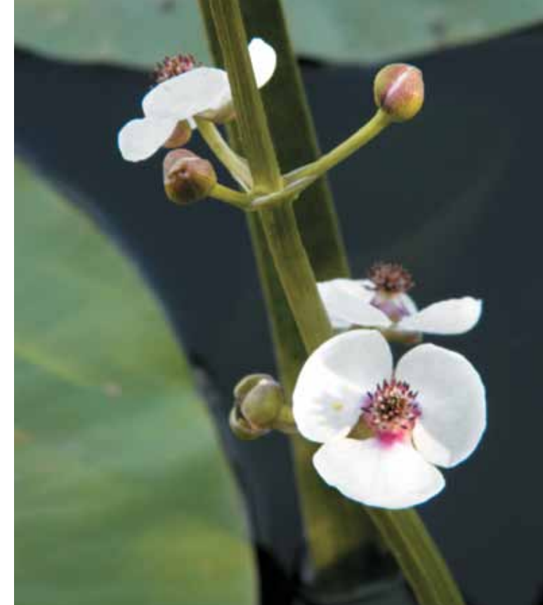
▲ Šípatka střelolistá.

Na rozdíl od Veltrubského a Libického luhu není Pňovský luh zvláště chráněným územím, spolu s nimi s dalšími lužními porosty níže po proudu Labe je však pod souhrnným názvem Libické luhy zahrnut mezi evropsky významné lokality. Důvodem je výskyt kuňky ohnivě, páchníka hnědého a roháče obecného. Ornitologové zdůrazňují i další zajímavé