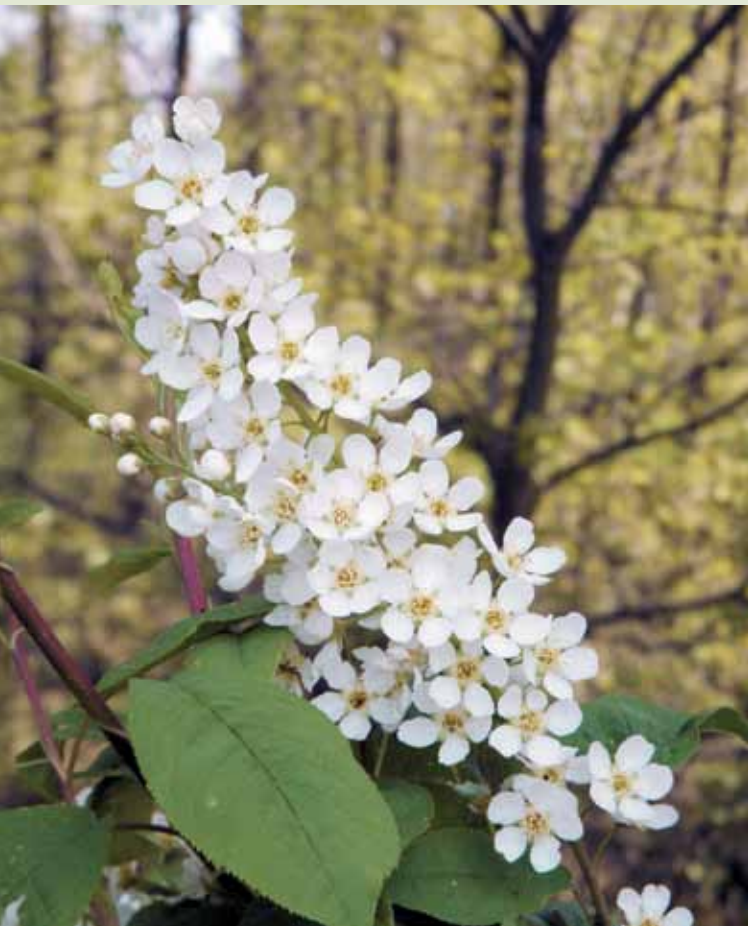
▼ Typickým keřem polabských luhů je střemcha.

druhy, kterým jsou polabské luhy domovem. Luňák červený, včelojed lesní, čáp černý, lejskové, datli... Vidět některého z těchto vzácných obyvatel však chce velké štěstí, a nebo velkou trpělivost. Co však může obdivovat každý, je velká pestrost botanická.