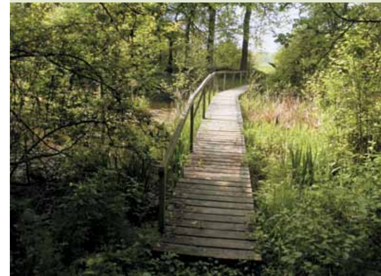
▼ U zastávky č. 10.