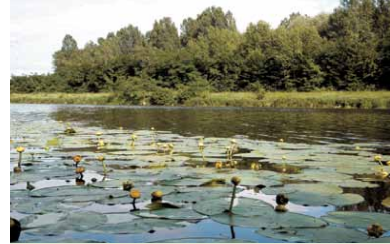
▲ Stulík žlutý.

I to, stejně jako řadu místních pověstí a dalších zajímavostí, se dozvíte na této naučné stezce. ■