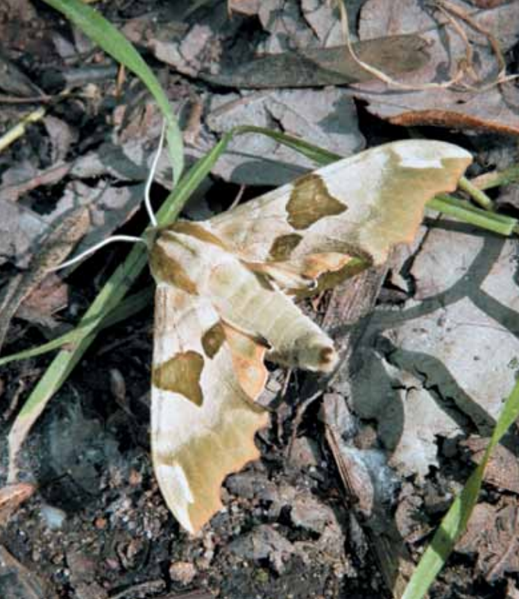
▲ Lišaj lipový.