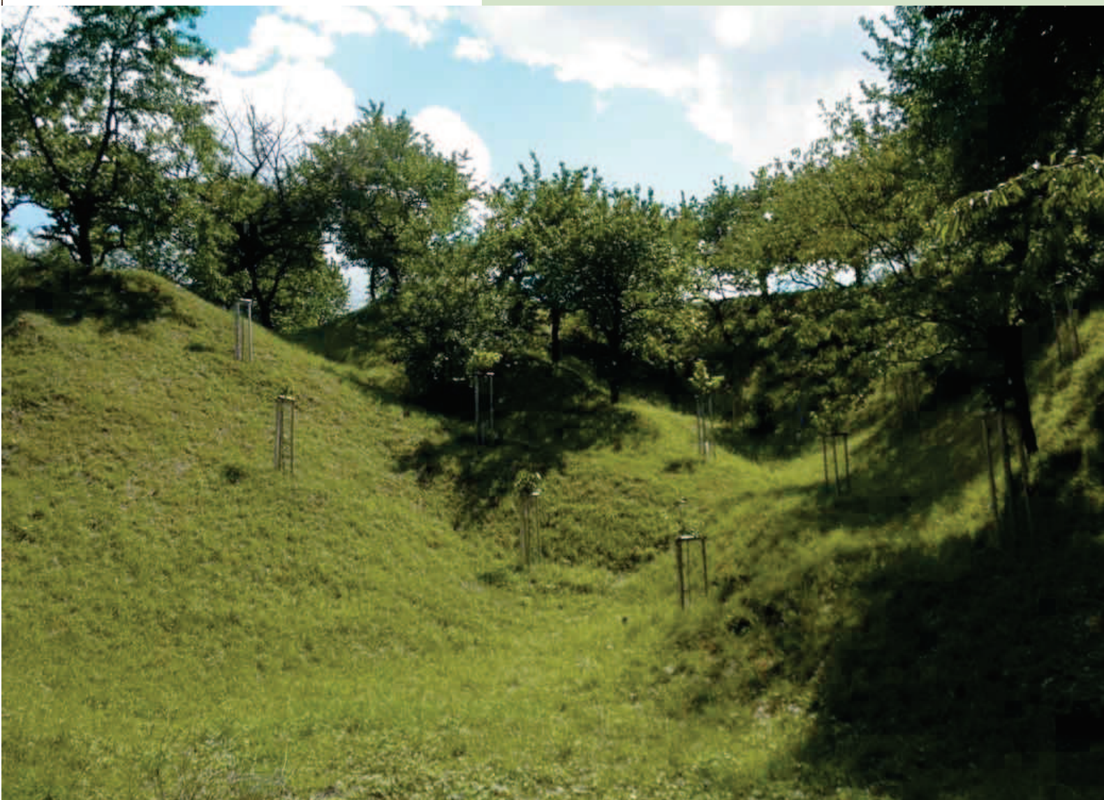
▼ Sad v bývalé pískovně v Houslích, nové výsadby starých odrůd třešní.