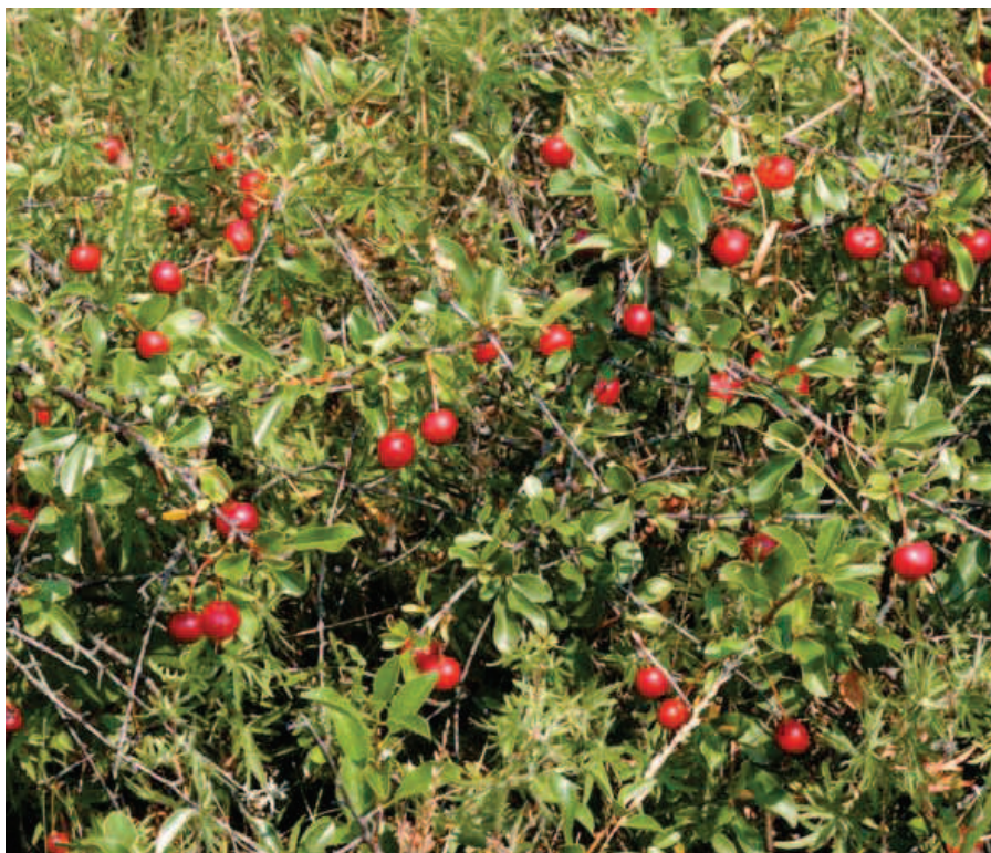
▲ Třešeň křovitá ( Prunus fruticosa ).

Mnoho zajímavého najdeme i v ochranném pásmu přírodní památky. V jedné z menších bývalých